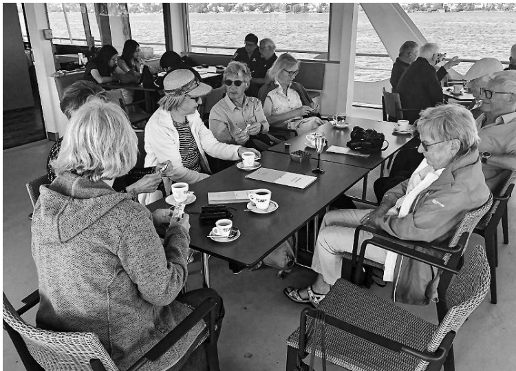
Im Schiff «Helvetia» auf dem Zürichsee

Danke an Doris und Werner für den sehr schönen Ausflug!