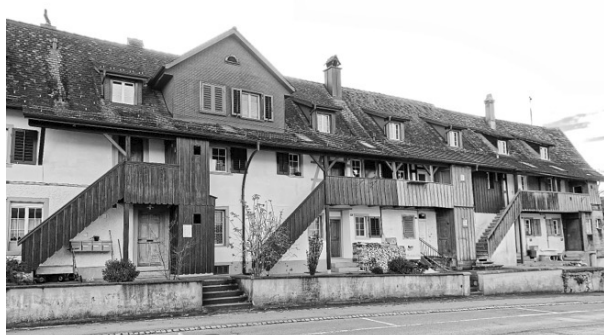
Typische Langhaussiedlung in Hauptwil

In Hauptwil baute die Familie Gonzenbach, ursprünglich aus Bischofszell, im 17. Jahrhundert eine Industriesiedlung zur Tuchherstellung mit rund 40 Wohn- und Gewerbehäusern. Die Textilien wurden mit Bleichen und Färben veredelt. Der Bahnhof Hauptwil ist der Ausgangspunkt zum Industrielehrpfad. Zahlreiche Tafeln erklären die Geschichte und die Zusammenhänge. Viele Gebäude sind in Hauptwil erhalten geblieben. Der Industrielehrpfad führt anschliessend am Schloss Hauptwil vorbei nach Bischofszell, der Thur entlang und endet bei der Konservenfabrik.