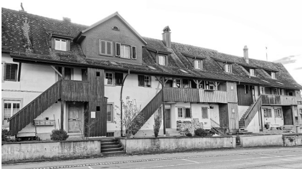
Typische Langhaussiedlung in Hauptwil

In Hauptwil baute die Familie Gonzenbach, ursprünglich aus Bischofszell, im 17. Jahrhundert eine Industriesiedlung zur Tuchherstellung mit rund 40 Wohn- und Gewerbehäusern. Die Textilien wurden mit Bleichen und Färben veredelt. Der Bahnhof Hauptwil ist der Ausgangspunkt zum Industrielehrpfad. Zahlreiche Tafeln erklären die Geschichte und die Zusammenhänge. Viele Gebäude sind in Hauptwil erhalten geblieben. Der Industrielehrpfad führt anschliessend am Schloss Hauptwil vorbei nach Bischofszell, der Thur entlang und endet bei der Konservenfabrik.