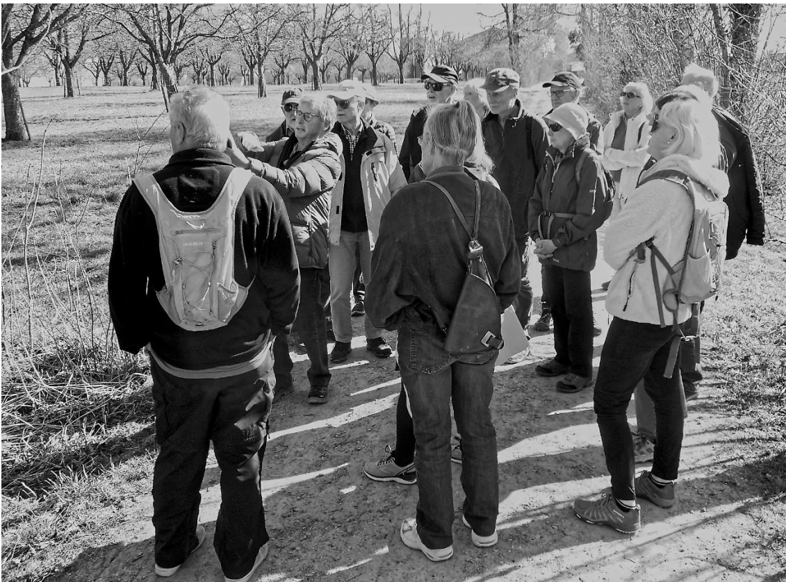
Am Ursprung des Stichbaches